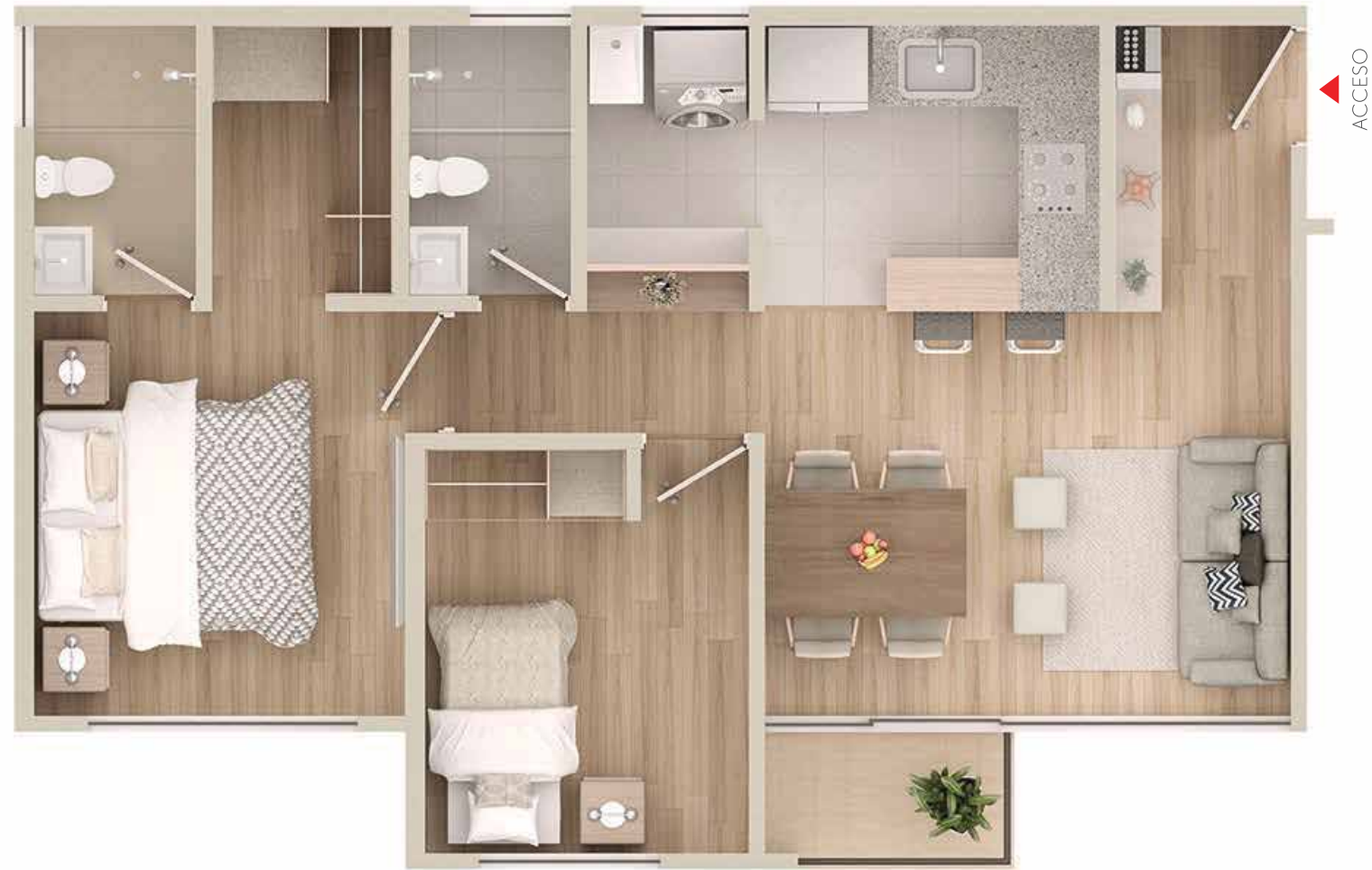
Planta 1 er piso