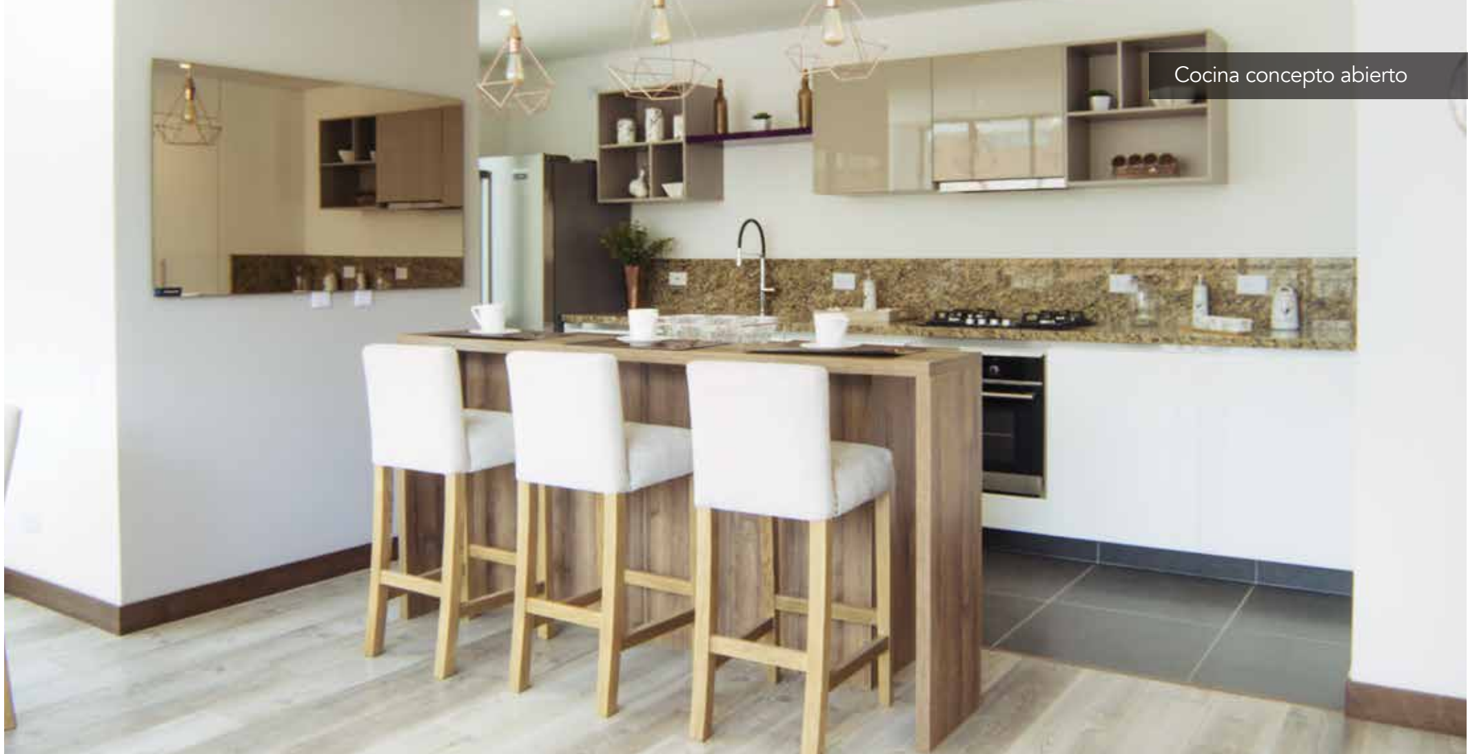
Cocina concepto abierto