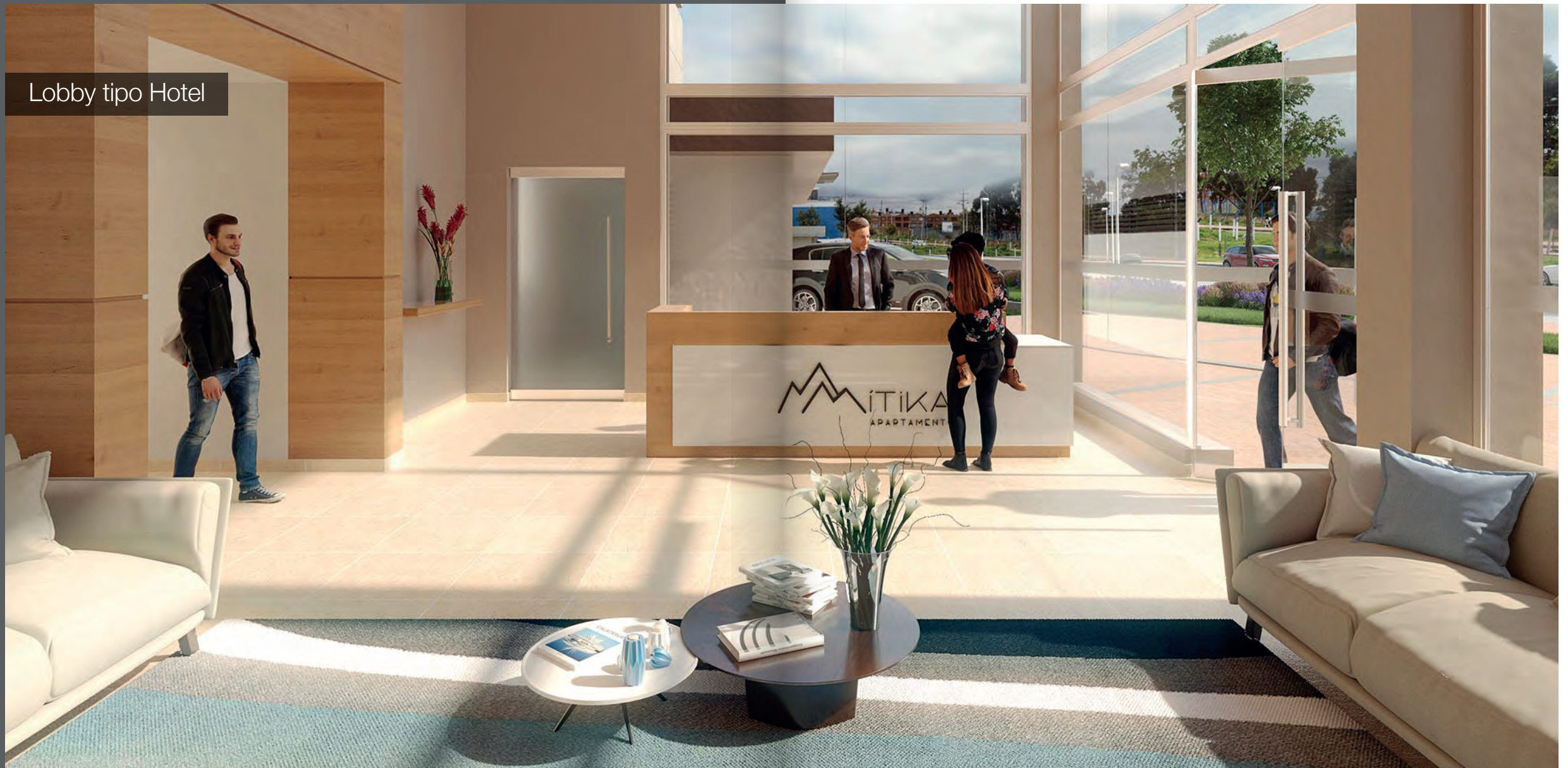
Lobby tipo Hotel

* Las imágenes contenidas en los impresos, renders, videos, folletos, brochures, volantes, oferta en sala de negocios, representaciones digitales, planos, maquetas, apartamento modelo y en la totalidad de las piezas publicitarias del proyecto podrán sufrir variaciones posteriores, ya que contienen elementos de apreciación estética que son interpretación del artífice de la pieza publicitaria y no configuran compromiso contractual por parte del Promotor, Gerente o Constructor.